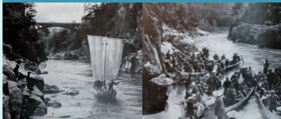
回顾从德川时代开始的天龙川水运历史。