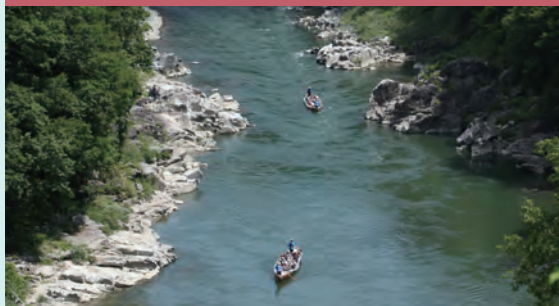
请享受连续急湍的刺激旅程。

请穿戴自动膨胀式救生衣。 若救生衣传感器接触到水后会感应，利用气筒的气压自动的膨胀。