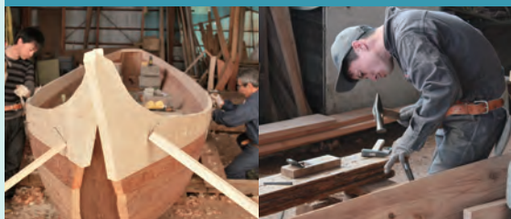
相传技术之一。打船钉时的独特节奏。