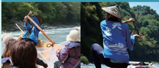
相传技术之一。一把船桨能操控12米长的和船。